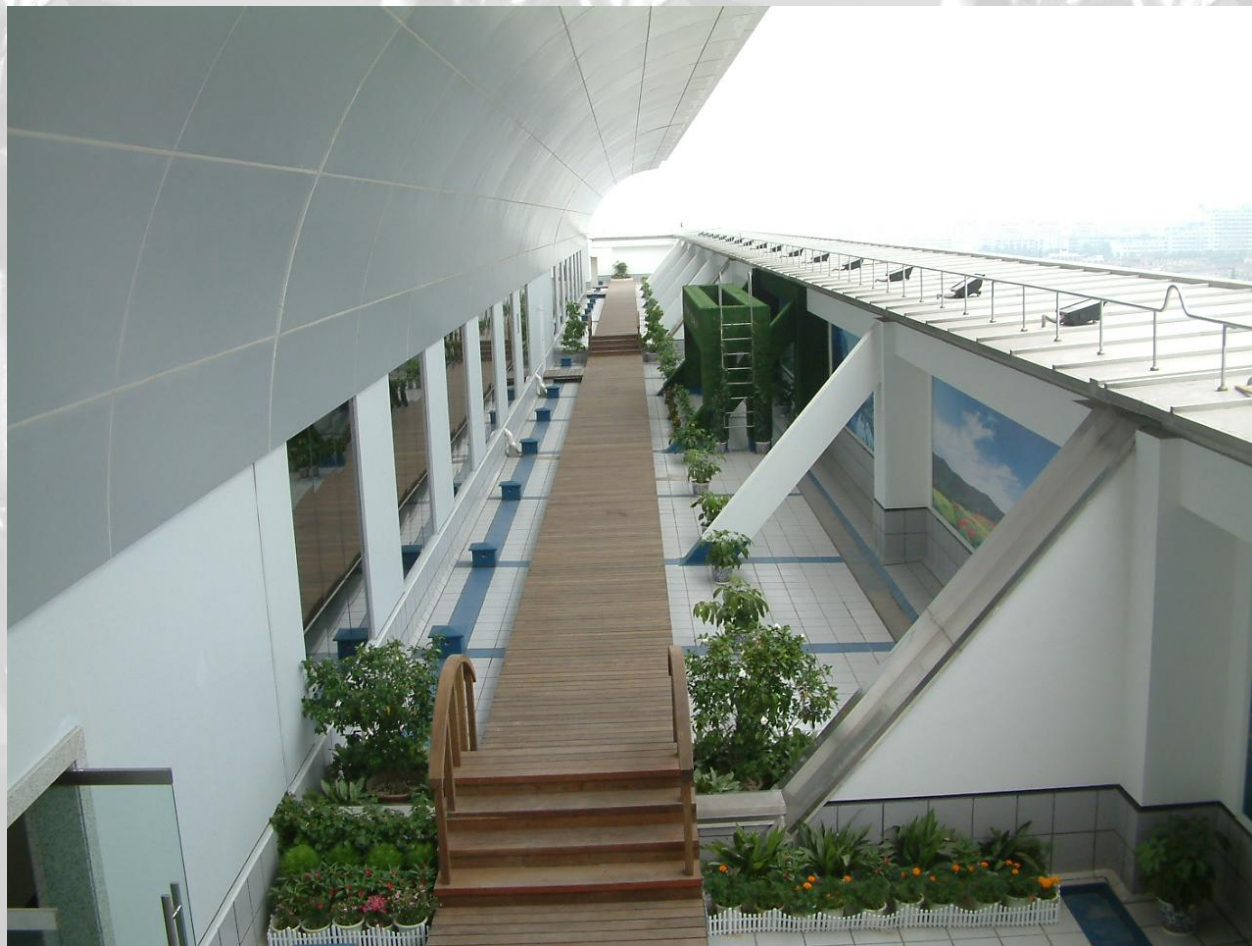
半开敞式花园屋面走道，色泽协调一致